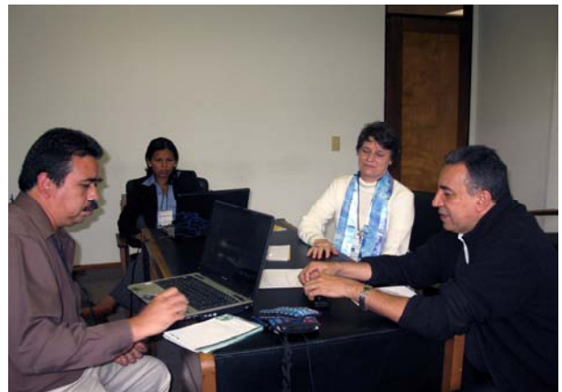
Trabajando durante el Encuentro en Bogotá