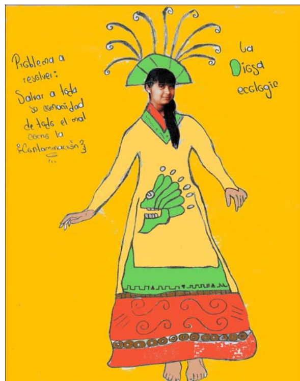
"Estudiantes hijos de migrantes"