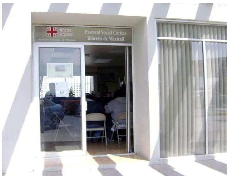
Módulo Fronterizo "Juntos en el Camino"

"Oh Dios! mientras los recordamos te agradecemos. Por el ejemplo de sus vidas. Por la dulzura de su compañía. Por sus veneradas memorias y por la inspiración que dejaron en nosotros".