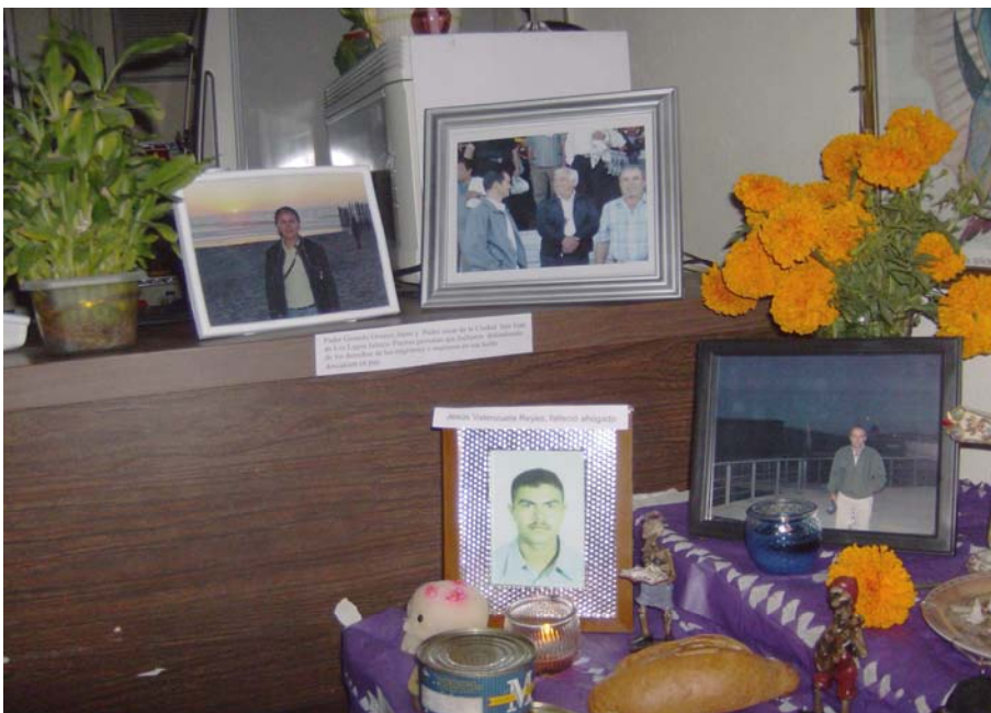
El altar de muertos donde se pusieron fotos de los hermanos y hermanas migrantes ya fallecidos y de quienes dieron su vida luchando a favor de ellos