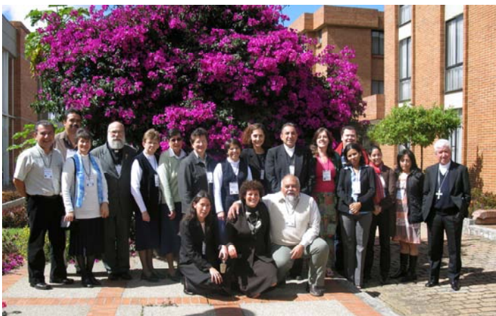
Asistentes al Encuentro Latinoamericano sobre la Trata de Personas en Bogotá, Colombia