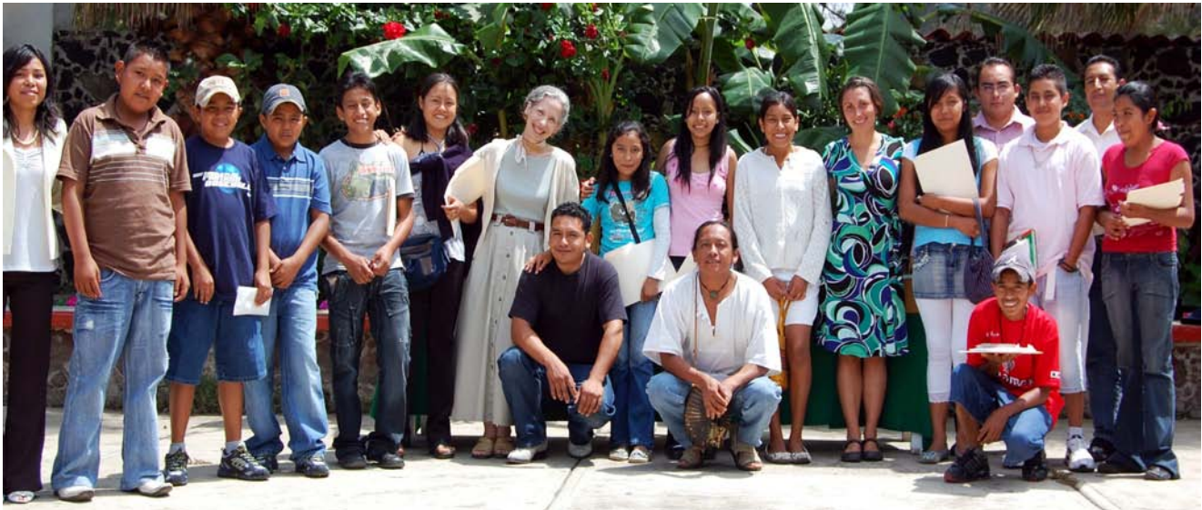
"Los maestros comunitarios y estudiantes del programa de verano de Proyecto El Rincón"