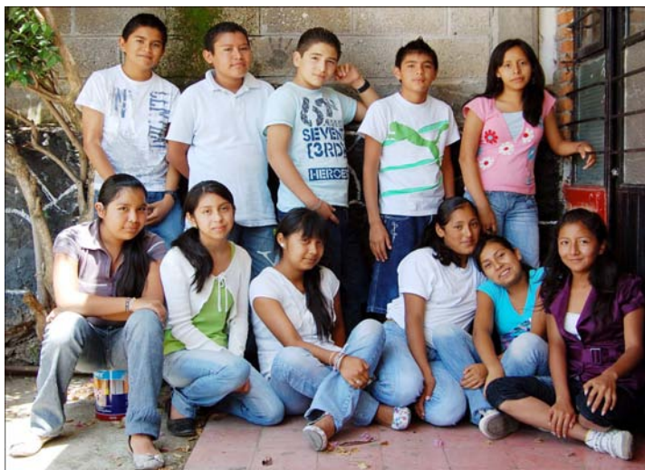
"Estudiantes en hermandad, hijos de migrantes"

Un día leímos una historia sobre una niña indígena, cuya abuela había anunciado a la familia que terminando la pieza de telar que tejía, ella regresaría a la " Madre Tierra ".