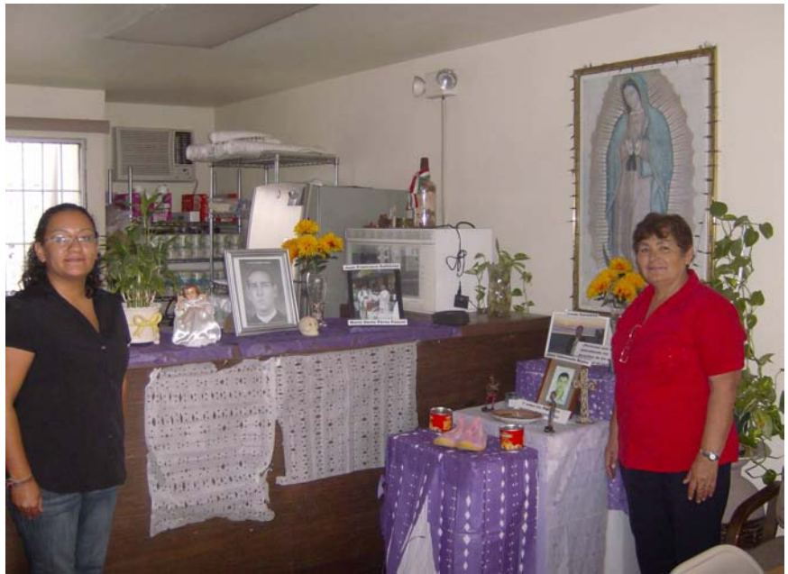
Un significativo altar para recordar a nuestros hermanos migrantes ya fallecidos