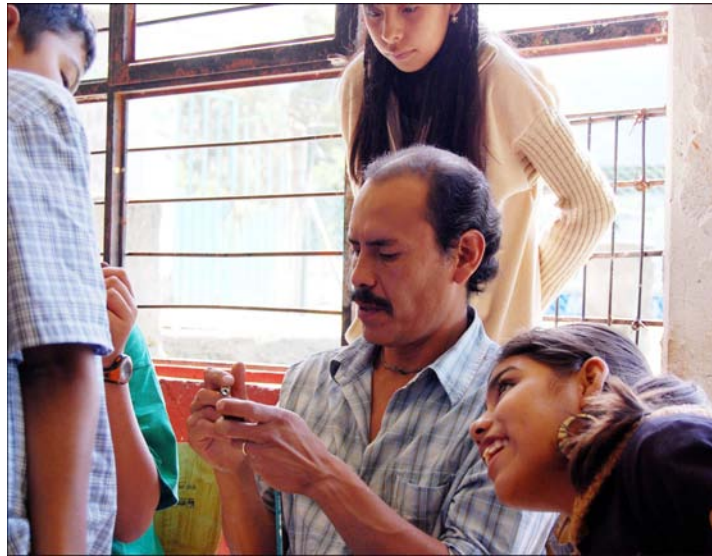
"Maestro tallador enseñando a jóvenes hijos de migrantes"